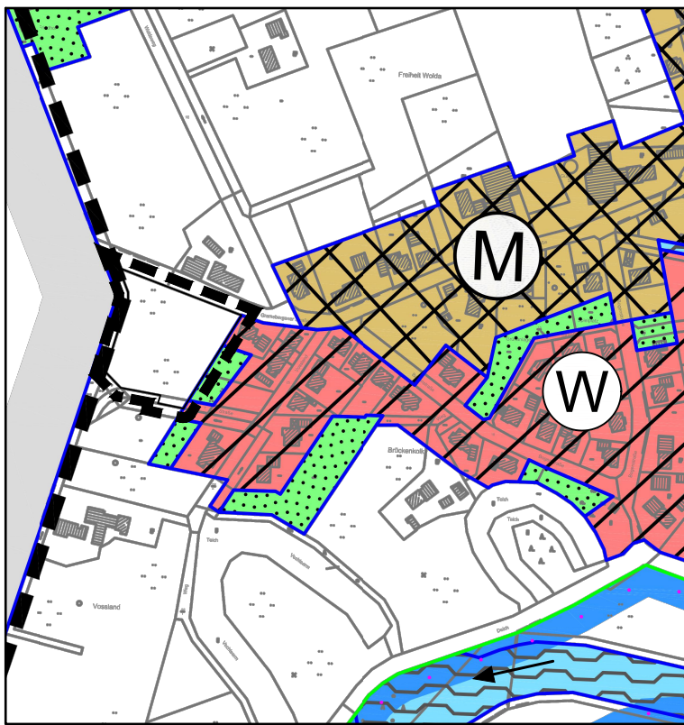
WIRKSAMER FLÄCHENNUTZUNGSPLAN M. 1:5.000